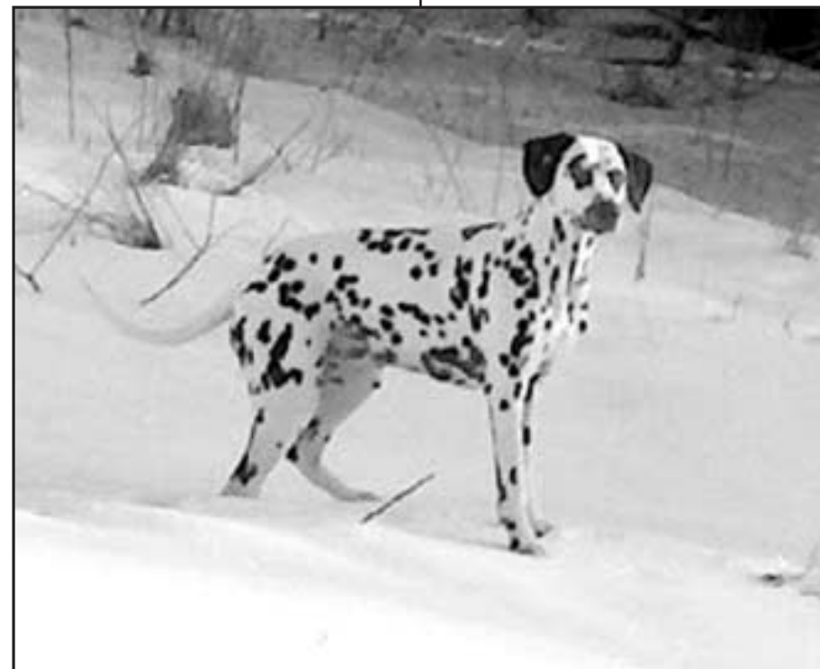
Donna i sneen (Sport Thymus Amazing Amokka)