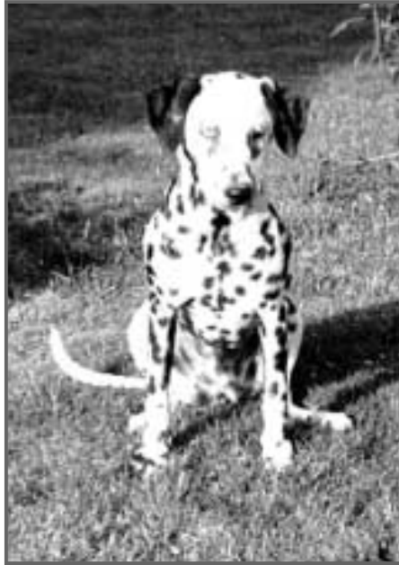
Ponto 1 år

NB. Opdr. af Ponto ville have, den skulle hedde Stjerneøje, det synes jeg dog ikke, men set i bagespejlet, kunne det have været sjovt at kalde den »Stjerne«, når jeg senere fik en »Kerne« og en »Terne«!!!