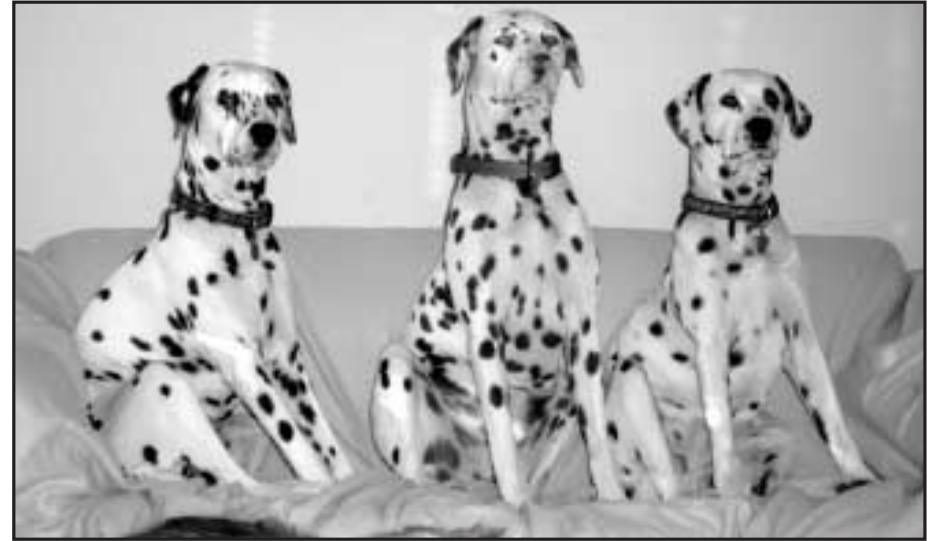
Foxy Spots Anastacia (Lotus), Ricko og Gyldenmoses Kajsa

I sommer var vi ude på Årslev internat, de havde fået en dalmatiner ind, som de mente lige var noget for os.