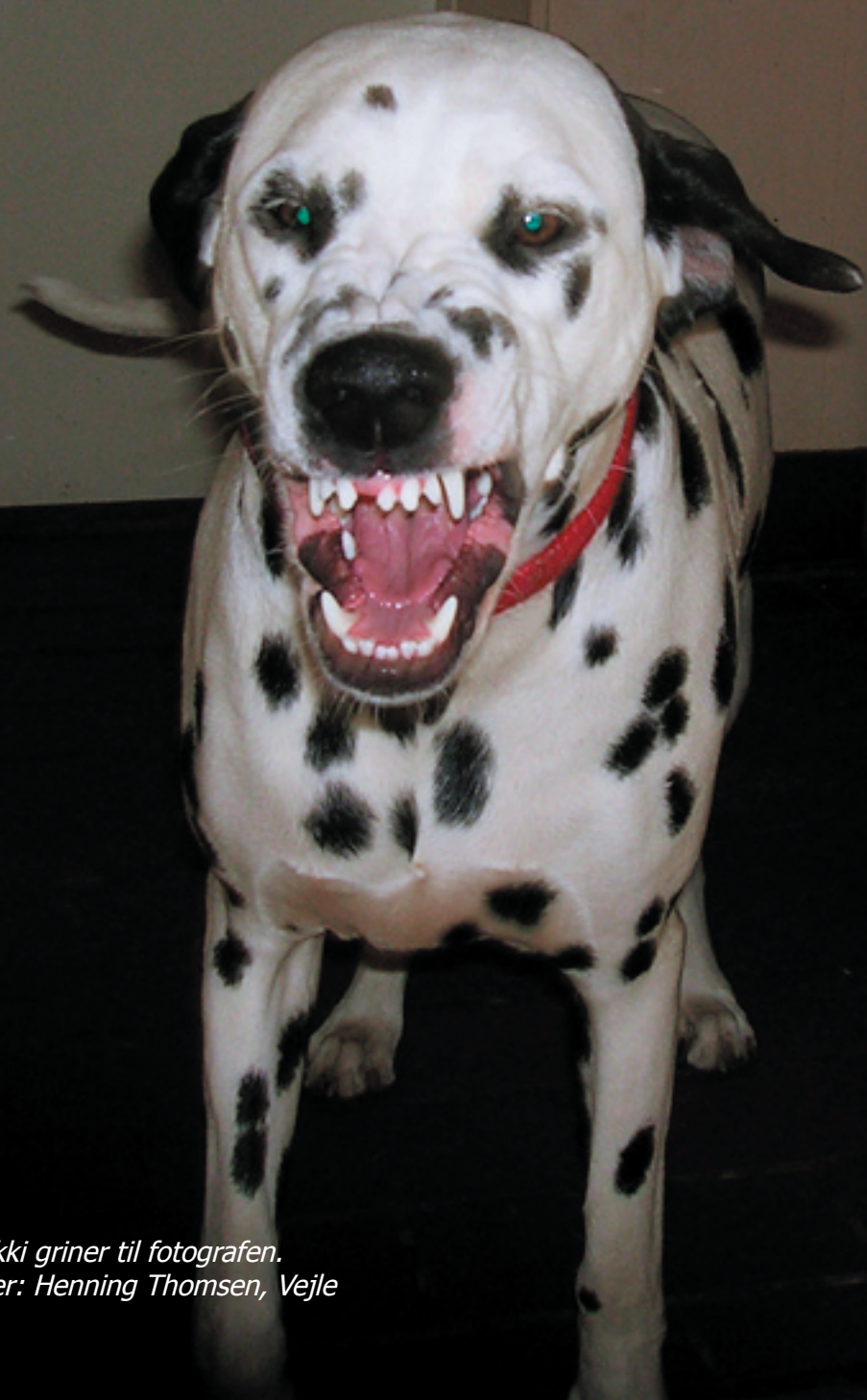
Nikki griner til fotografen. Ejer: Henning Thomsen, Vejle