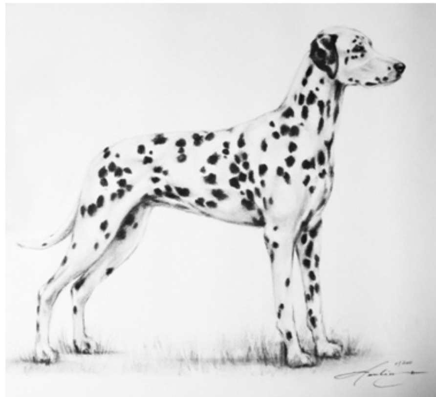
Illustrationen viser ikke nødvendigvis det ideelle eksemplar af racen

Efter dannelsen af Dalmatiner klubben i England i 1890 blev denne standard overført som den første officielle race standard. FCI publicerede den første Dalmatiner standard d. 7. april 1955 under navnet "Dalmatisk jagthund".