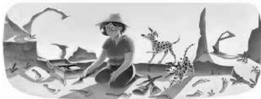
Google - Mary Leakeys 100th birthday