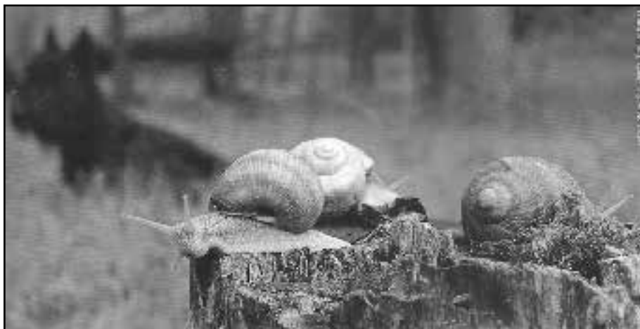
Snegle er mellemvært for Hjerte-lunge-orm, så hundene smittes, ved enten at spise snegle eller slikke på deres slimspor.

Vi ved, at hunden smittes ved kontakt med snegle - enten ved at spise dem eller ved at slikke på det slimspor, som sneglen sætter, når den kryber hen over jord og blade. Det betyder, at hundene kun bliver smittet i den periode, hvor der er aktive snegle i haver og naturen.