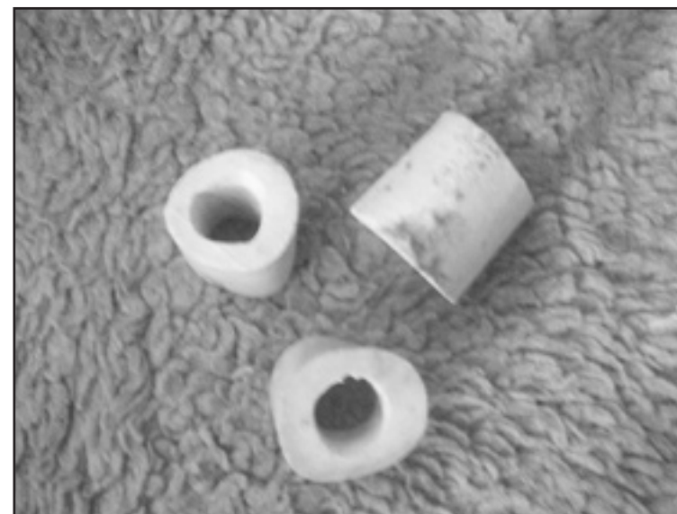
Lige et billede af nogle ben, så det er helt klart, hvad jeg snakker om. Disse ben er så små, at hundene ikke kan få dem rundt om kæben!!