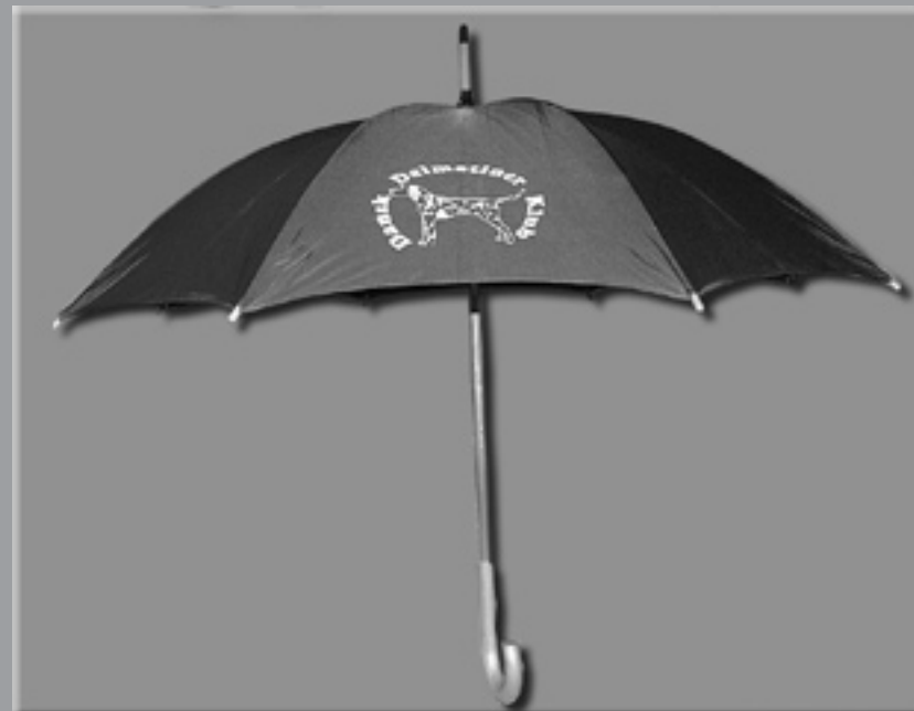
Dalmatiner-paraply: Pris: 85 kr. + fragt Medlemspris 70 kr. + fragt