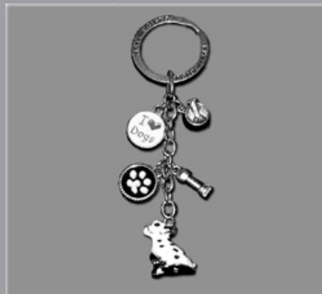
Dalmatiner-nøglering: Pris: 80 kr. + fragt Medlemspris 70 kr. + fragt