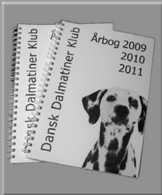
Årbog 2009/2010 + 2011: Pris: 135 kr. + fragt Medlemspris 105 kr + fragt

Følgende Dalmatiner priksager kan bestilles via Dalmatiner klubben e-mail: danskdalmatinerklub.kasserer@mail.dk