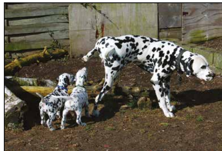
"Det er sådan man gør, drenge!" – Kernehuset's Bacardi (Bacardi) på hvalpebesøg.

Der er rigtig mange forskellige opgaver, der skal fordeles og udføres under en klubudstilling. Og vi hjælpes alle ad, som vi har tradition for. De danske udstillere vil blive kontaktet for tildeling af opgaver.