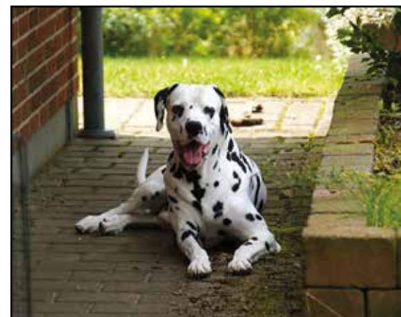
Kenzo (Frihedens Szar Sarozza)

Per Plougmann Holbækvej 24, Holdbæk 8950 Ørsted Telefon: 60541051 Mail: supl1@dalmatinerklubben.dk