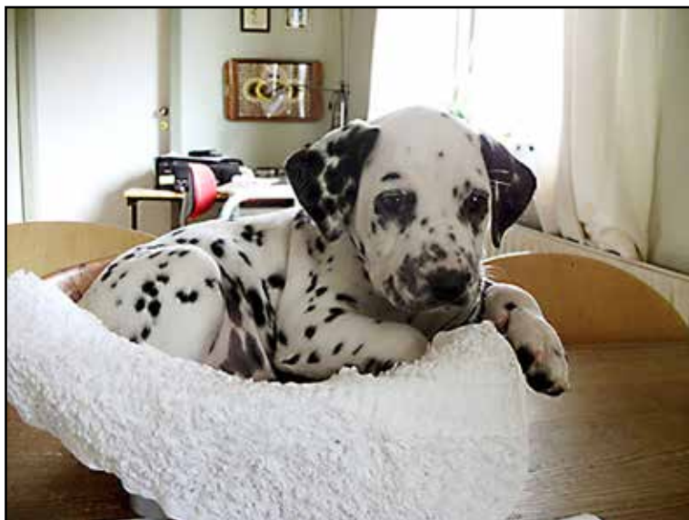
"Nova på vægten ca. 3 uger gammel

EX1. CK. veteranklasse BTK2. BEDSTE VETERAN