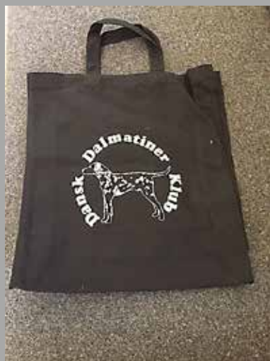
Indkøbsnet: Pris: 75 kr. + fragt