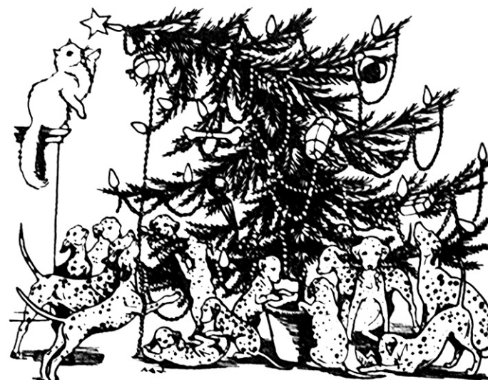
Billedet stammer fra Dodie Smith's bog "101 Dalmatiner". Den var baggrunden for den senere tegnefilm af samme navn.