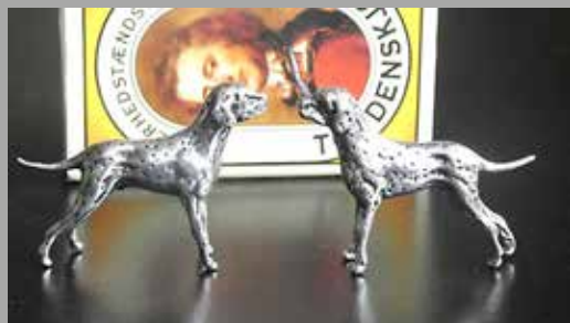
Sølv dalmatiner: Pris: 75 kr. + fragt

Følgende Dalmatiner priksager kan bestilles via Dalmatinerklubben e-mail: kasserer@dalmatinerklubben.dk