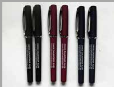
Kuglepen: Pris: 20 kr. + fragt