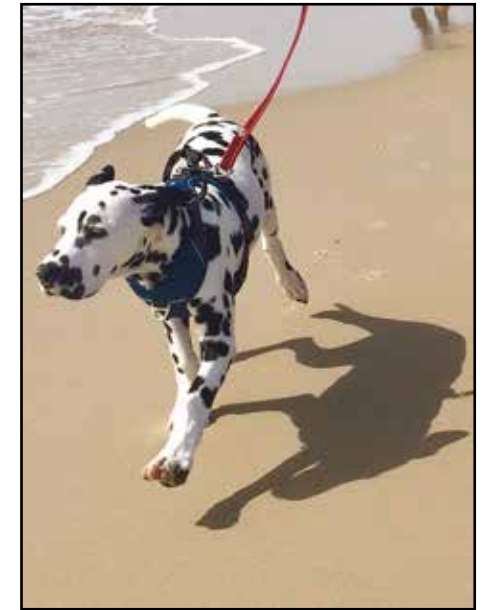
Louis (Louis er en af Pixels sidste kuld fra januar) på ferie i Blåvand for første gang på standen.

Det er som sagt dyrt og tager lang tid at passe sin gamle hund. Mange hundeforsikringer dækker dog nogle akupunkturbehandlinger pr. år.