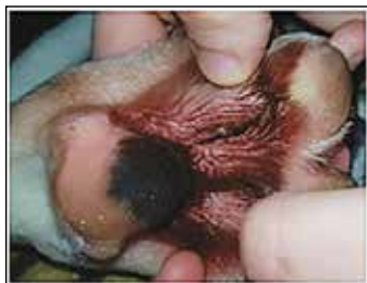
Figur 3: Pote fra dalmatiner med atopisk dermatitis

Hunde, som lider af atopisk dermatitis har et immunsystem, som reagerer på agens, der bliver optaget gennem kroppen fra miljøet – de optages gennem huden, luftvejene og tarmsystemet.