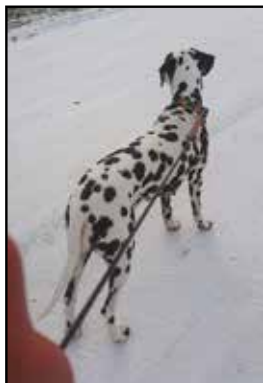
Pixel venter på Maddox.

En parring er altid lidt nervepirrende; især når det er første gang for én af parterne. Jeg synes, at det plejer at gå bedst, hvis hundene går en lille tur