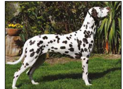
VDH/DVD 4798 -- Hvid M Brun Far: Absolern vom Gramzower Kloster Mor: Samoa vom Schwarzen Berg O: Barbara & Harald Böttcher, Tyskland E: Sassi Scholz, Tyskland

Dommer: Stephanie Langanke, DE. BTK2 - CERT. Championat Wenaria vom Schwarzen Berg