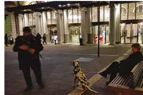
Hvilepause ved Centralstationen i Stockholm.

Pixel var en utrolig sød og tålmodig rejsekammerat. Hun var dog ikke glad for togsiftene; for de stejle trapper ind i togene og den store afstand mellem trin og perron var noget skræmmende. Både på udrejsen og hjemrejsen gjorde