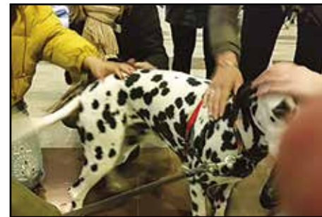
Pixel vakte opsigt overalt. Her har en flok unge piger kastet sin kærlighed på hende. Selv om de klapper hende alle de steder, man ikke bør, logrer hun alligevel, og vi holder øje med, at hun stadig er godt tilpas.

vi et ophold på 3 – 4 timer i Stockholm for at være lidt turist, spise ordentligt, og for at Pixel kunne strække benene og slappe lidt af med andet end togrejse. Overalt hvor vi kom frem – på stationerne, på gaden og i togene - vakte Pixel opsigt. Hun blev klappet og fotograferet i stor stil. Svenskere, amerikanere, indere og mange flere fik hun snakket med.