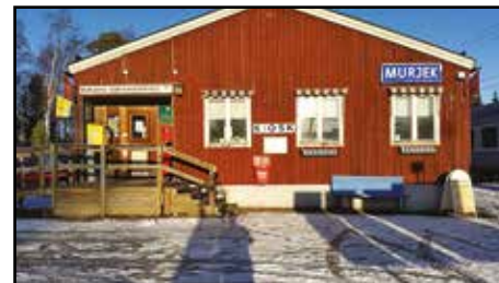
Togstation på vejen.

vi et ophold på 3 – 4 timer i Stockholm for at være lidt turist, spise ordentligt, og for at Pixel kunne strække benene og slappe lidt af med andet end togrejse. Overalt hvor vi kom frem – på stationerne, på gaden og i togene - vakte Pixel opsigt. Hun blev klappet og fotograferet i stor stil. Svenskere, amerikanere, indere og mange flere fik hun snakket med.