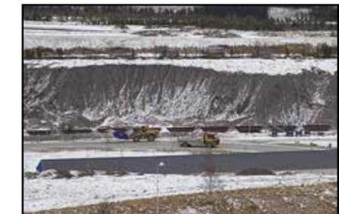
Malmbruddet i Gälliväre.