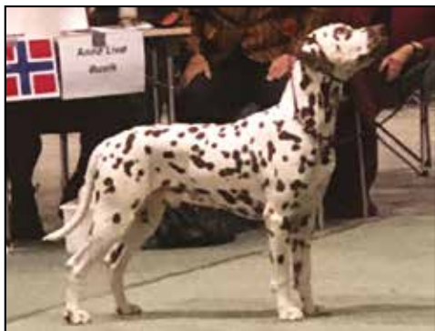
SE13029/2016 - Hvid M brun Far: Perdita's Sparkling Star Mor: Multi Ch. Jilloc's Splendid Choice O: + E: Florence Brunberg Johansen Sverige

Elegant hanhund, harmonisk bygget, altting passer sammen, vel-skåret prismehoved i fine proportioner, korrekt bid, velansatte ører i fin størrelse og kvalitet med fin plet fordeling, prima hals, manke og topline, korrekt kryds, velansat hale i fin længde, veludviklet forbryst, fin skulder placering, velformet brystkasse, fine knogler, velformet poter, fin pletfordeling over alt, frie bevægelser med godt afskub, venligt temperament